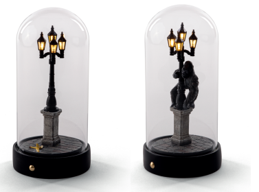
MY LITTLE CORNER_10466 MY LITTLE KONG_10465

本製品は、家庭ごみとして廃棄することはできません。本製品は、電気および電子機器に関する欧州指令 2012/19/EU (WEEE) に従って表示されています。この指令は、廃棄される電気電子機器の回収とリサイクルにおける規則を定めたもので、EU 圏内で有効です。廃棄される機器の回収については、本製品を使用する国で定められている廃品回収システムに従ってください。