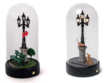
MY LITTLE VALENTINE_10469 MY LITTLE EVENING_10464